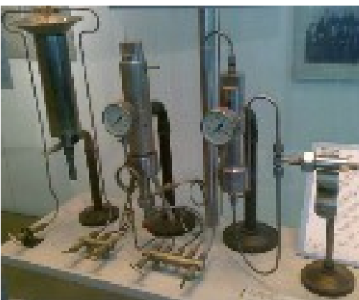
FIGURE 1 – Appareil de laboratoire utilisé par Haber pour la synthèse de l'ammoniac

La production industrielle d'ammoniac par le procédé Haber-Bosch prolongea la Première Guerre mondiale en fournissant à l'Allemagne le précurseur de la poudre à canon et d'explosifs nécessaires à son effort de guerre, alors même qu'elle n'avait plus accès aux ressources azotées traditionnelles, principalement exploitées en Amérique du Sud. La guerre terminée, les alliés eurent recours à de l'espionnage industriel pour s'emparer des secrets de l'industrie chimique allemande : leur industrie avait en effet un important retard technologique sur les sociétés allemandes. Actuellement, la quasi totalité de l'ammoniac est produite grâce au procédé Haber-Bosch.